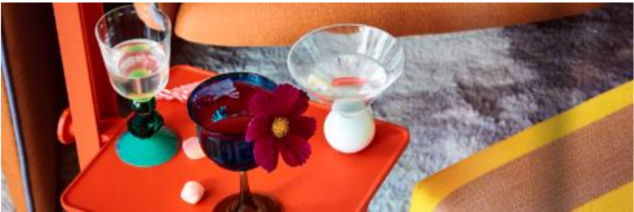
Here Comes the Sun. Catálogo Formex 2024.

Se busca la emoción tanto en colores y formas. La paleta de colores toma como referencia esta década, en la que destacan distintas gamas de naranjas. Se observan combinaciones atrevidas, como naranjas con granates, aunque también se deja espacio a los tonos clásicos como el blanco roto.