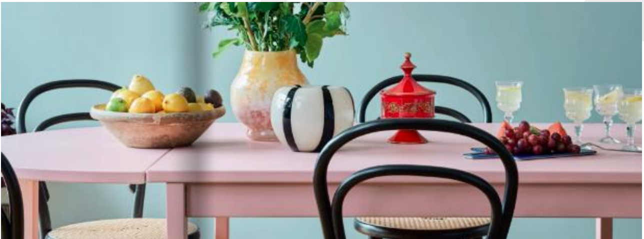
Itsy Bitsy . Catálogo Formex 2024.

La paleta de colores se inspira en tonos pastel, propios del verano sueco en el campo. Es un estilo que busca aprovechar al máximo la luz natural y el color junto a tonos pastel de rosa y azul.