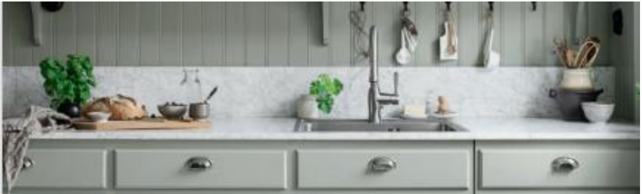
Green Grass of Home. Catálogo Formex 2024.

Para evocar estos sentimientos se buscan distintos tonos de verdes, desde tonos cálidos a oscuros. El color verde evoca la vida y, junto a distintos marrones y azules, conforman los colores propios de la naturaleza. Se busca la simplicidad, tanto en apariencia como en función, combinando objetos y muebles antiguos y nuevos, seleccionados y cuidados para perdurar tanto en calidad como en diseño. Esta idea es muy valorada en esta temporada, y se opta por productos que se puedan reparar o reutilizar en un futuro. De este modo, los materiales que se proponen son atemporales, naturales y durables, como el vidrio y la madera.