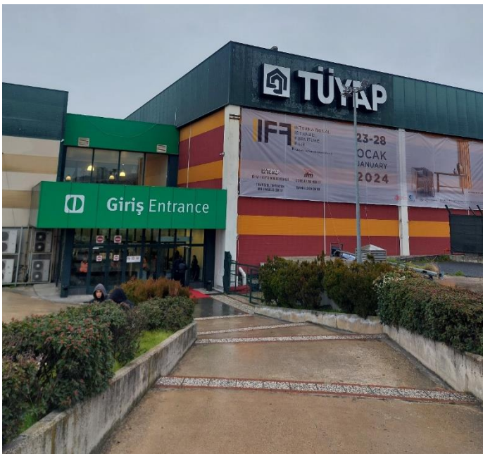
FOTOGRAFÍA 1. ENTRADA AL RECINTO DE TÜYAP